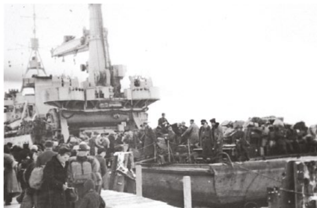
Ffig 4: Ffoaduriaid yn ffoi o Königsberg cyn dyfodiad y Fyddin Goch ym 1945

Amlinellir yr adran hon yr profiadau niweidiol hwynebodd plant Almaenig oherwydd dadleoli. Mae'n cwmpasu eu dihangfa, y tair blynedd o dan reolaeth Pwyleg a Sofietaidd ac ailsefydlu yng Ngorllewin yr Almaen. Roedd y ffoad ym 1944-1945 yn aml yn digwydd dan yr amgylchiadau anoddaf gan nad oedd yr awdurdodau Natsïaidd wedi caniatáu dianc tan yr eiliad olaf un. Roedd milwyr yr Almaen hefyd yn blaenoriaethu anghenion milwrol dros wacáu a llesiant y sifiliaid (Willems 2021, 207). Arweiniodd hyn at ffoaduriaid yn ffoi yng nghanol y gaeaf (tymheredd o -20C) gyda'r goresgyniad yn digwydd o'u cwmpas. Roedd dynion naill ai eisoes yn y fyddin neu'n cael eu gorfodi i ymuno â 'Milisia'r Bobl', felly menywod, plant, y sâl a'r henoed oedd yn bennaf ffoaduriaid. Roedd y teithiau'n gyfuniad yn bennaf o gerdded, wagen geffyl, trenau neu gychod. Roedd yr amodau ar y daith yn erchyll gyda ffoaduriaid yn croesi'r rheng flaen, yn profi ymosodiadau gan luoedd y gelyn, yn rhewi i farwolaeth ac yn boddi mewn llongau.