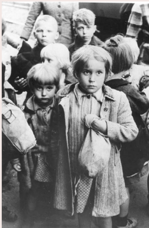
Fig 3: Awst 1948, plant Almaenig alltwladwyd o'r ardaloedd dwyreiniol a gymerwyd drosodd gan Wlad Pwyl yn cyrraedd Gorllewin yr Almaen.

Naratifau gan unigolion sydd o brif ddiddordeb i'r prosiect hwn. Cynhaliwyd tri ar ddeg cyfweiliad hanes llafar yn 2009-2011 gydag Allwladwyr a oedd dan 18 oed yn ystod eu dadleoliad. Ystyrir hefyd hunangofiannau a ysgrifennwyd gan blant oedd yn ffoaduriaid a gyhoeddwyd rhwng 1980-2011. Mae'r ffynonellau o'r fath yn seiliedig ar y cof ac felly'n darparu atgof o brofiadau unigol yn hytrach na disgrifiad manwl cywir o ddigwyddiadau wrth iddynt ddigwydd. Cânt eu siapio felly gan brofiadau'r unigolion rhwng y digwyddiad ac adeg y cofio, ac maent felly yn adnodd ardderchog ar gyfer deall sut y gwneir synnwyr o profiadau yng ngoleuni'r presennol (a'r hyn sydd wedi dod yn y cyfamser).