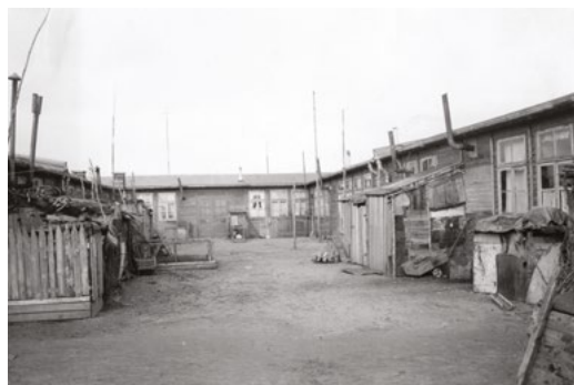
Ffig 5: Cyn wersyll i Allwladwyr yn Eckernförde, It 1951

Roedd gwersylloedd yn yr Almaen feddianedig ychydig yn well na'r rhai yn Nwyrain Ewrop ond roedd teuluoedd yn dal i fyw am flynyddoedd lawer mewn cytiau dros dro a oedd yn dywyll, fudr ac yn orlawn. Fe wnaeth yr amodau hyn waethygu ymhellach deimladau o ansicrwydd ac amarch ymhlith plant ffoaduriaid. Yn aml, roedd biledau yn waith byth gan fod yr 'brodorion' (Almaenwyr lleol) yn elyniaethus tuag at y ffoaduriaid serch taw cydwladwyr oeddynt. Rhoddwyd y llety gwaethaf i'r ffoaduriaid, megis ysguboriau neu siediau anifeiliaid, gan arwain at deimladau o gywilydd a diraddiad gydol oes. Mae cysondeb teimladau o'r fath ar draws adroddwyr a'u dyfalbarhad dros amser yn awgrymu y byddai'n fuddiol helpu plant sy'n ffoaduriaid i archwilio a goresgyn teimladau o gywilydd. Adlewyrchir hyn hefyd yn y llenyddiaeth ehangach ar deimladau o gywilydd a brofir gan ffoaduriaid a phlant sy'n ffoaduriaid (Stotz et al. 2015; Furukawa a Hunt 2011).