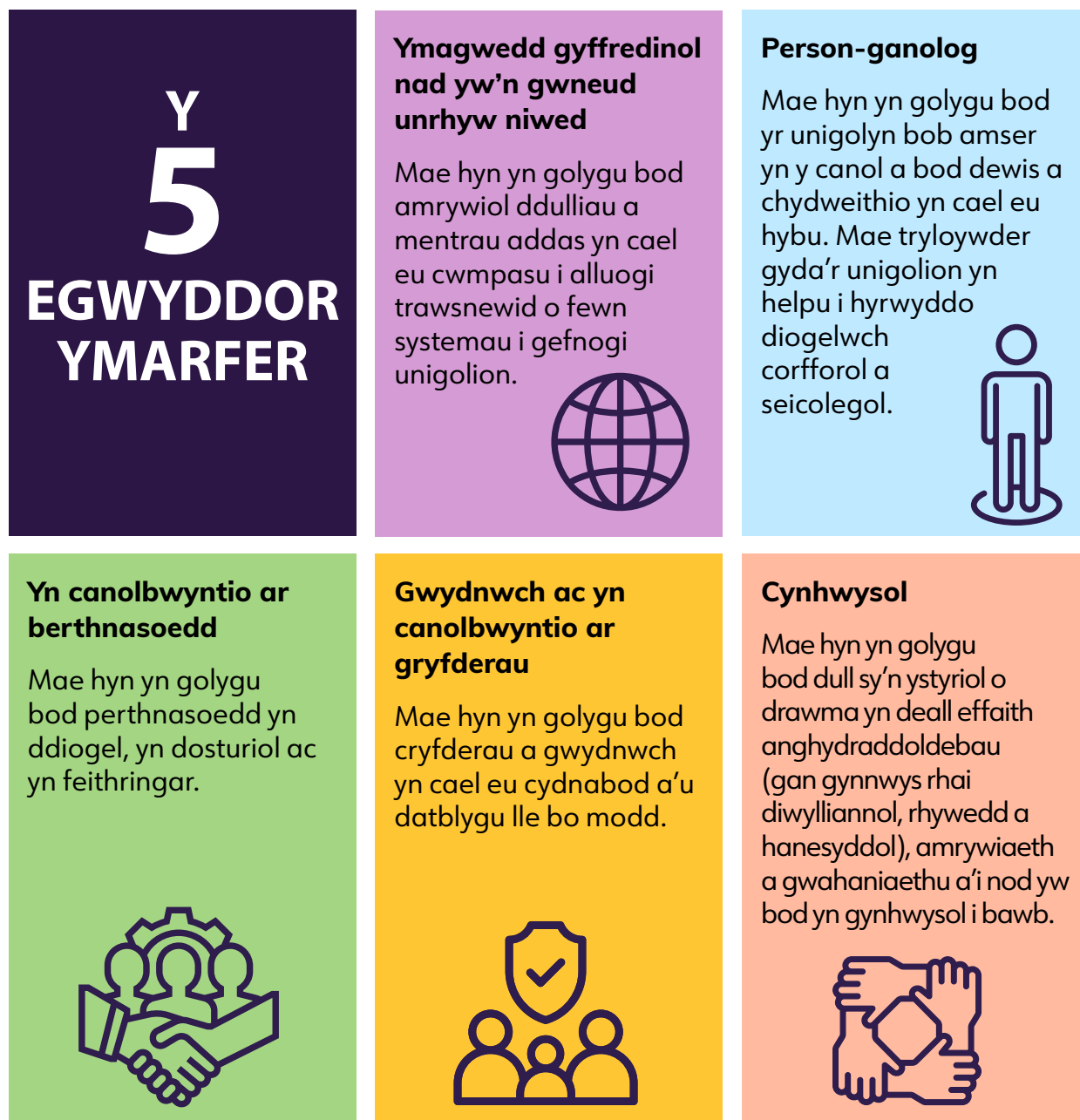
Diagram 1: Pum Egwyddor Ymarfer

Mae'r Fframwaith ' Cymru Ystyriol o Drawma: Ymagwedd Gymdeithasol at Ddeall, Atal a Chefnogi Effeithiau Trawma ac Adfyd ' wedi'i seilio ar gyfres o bum egwyddor ymarfer (gweler Diagram 1) ac mae'n bwysig ystyried sut y gellir cynnwys y rhain wrth lunio Datganiad o Ymrwymiad.